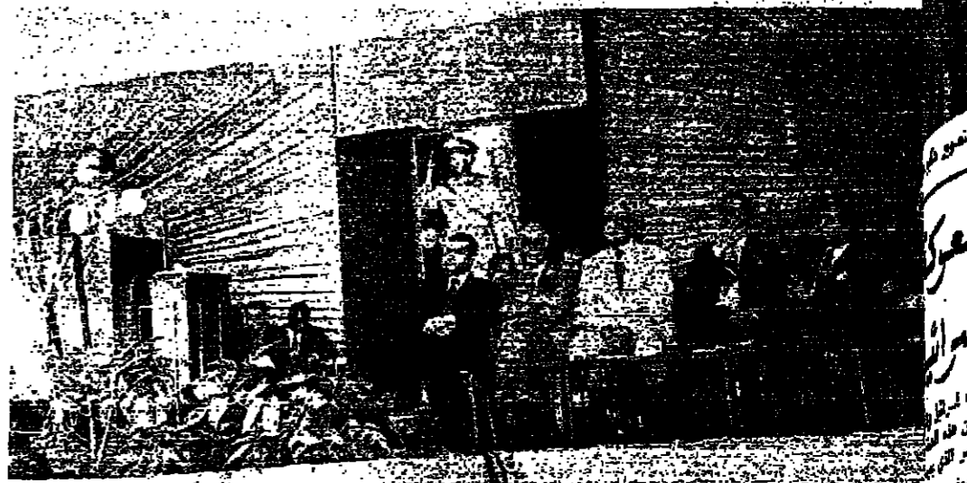
الرئيس السادات يلقي خطبه في أسبوط في ١٩٧٥